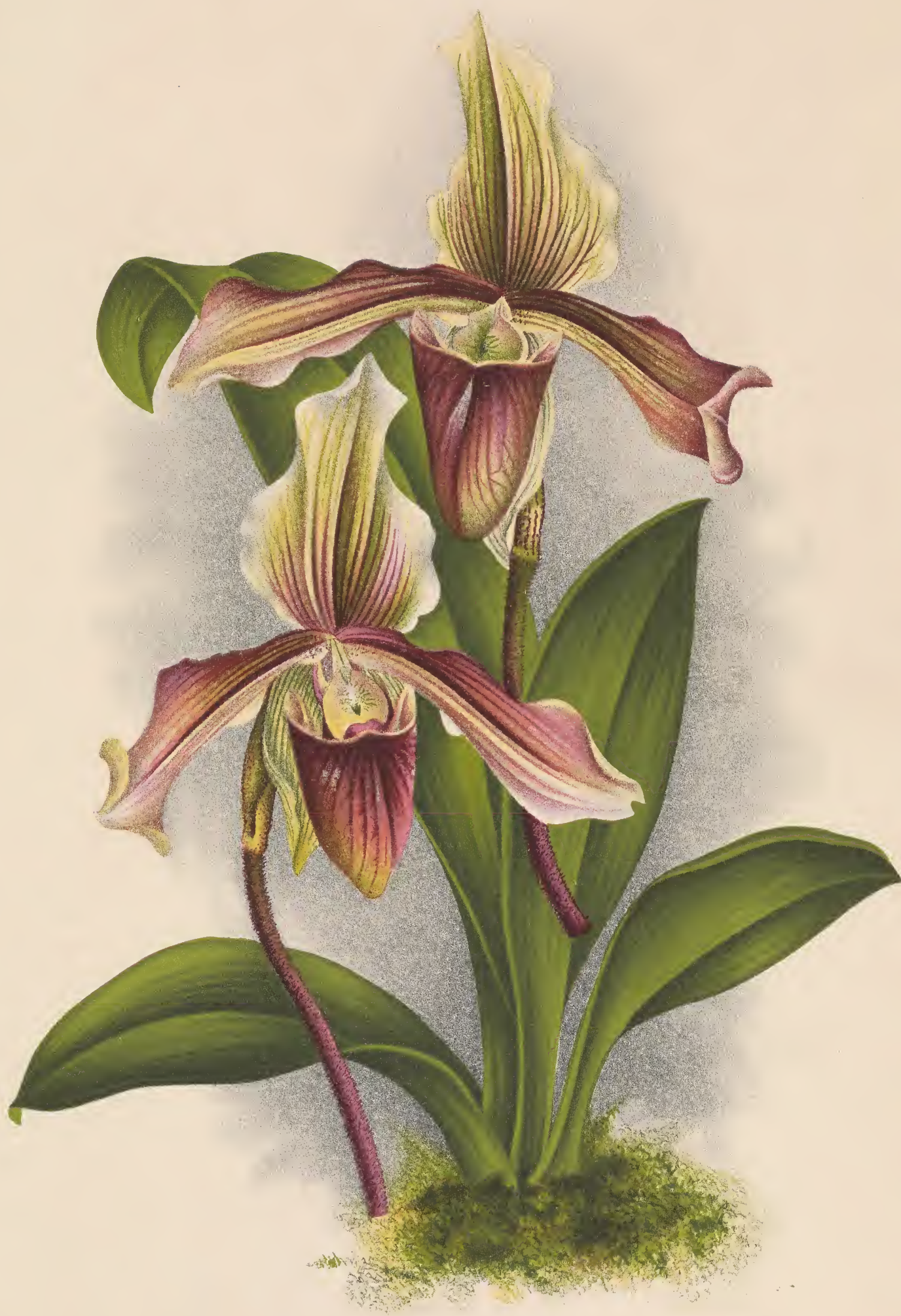
CYPRIPEDIUM × HAUMONTI L. LIND.