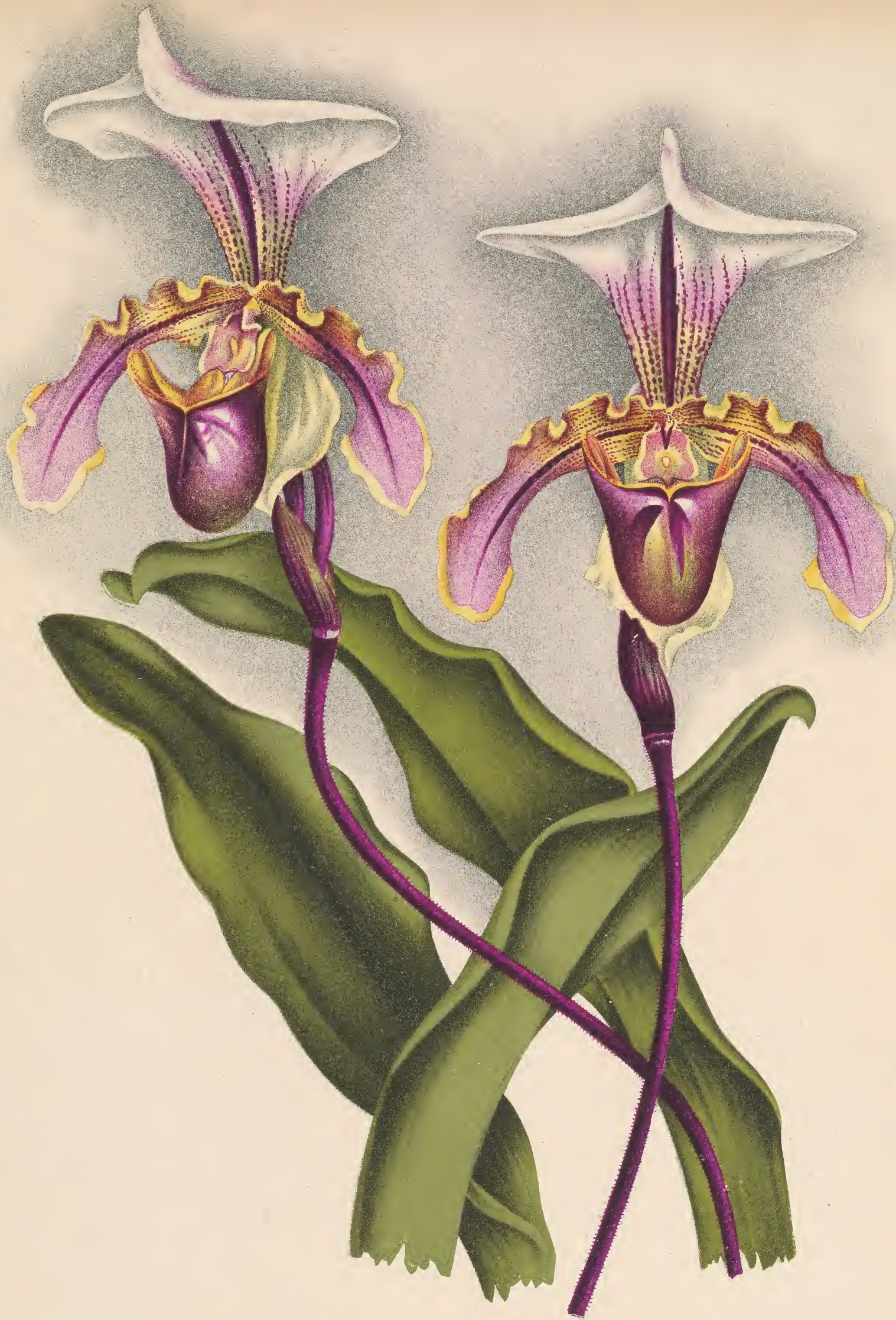
CYPRIPEDIUM × ALBERTIANUM HORT. var. ROTUNDIFLORUM HORT.