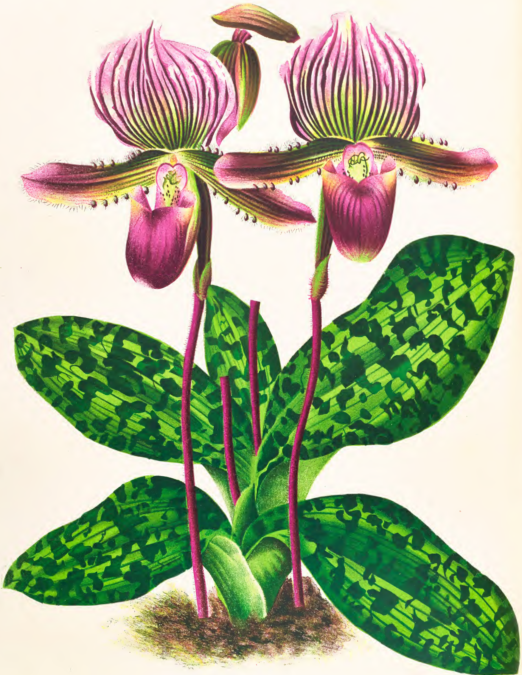
CYPRIPEDIUM LAWRENCEANUM RCHB. F. var. ARDENS L. LIND.