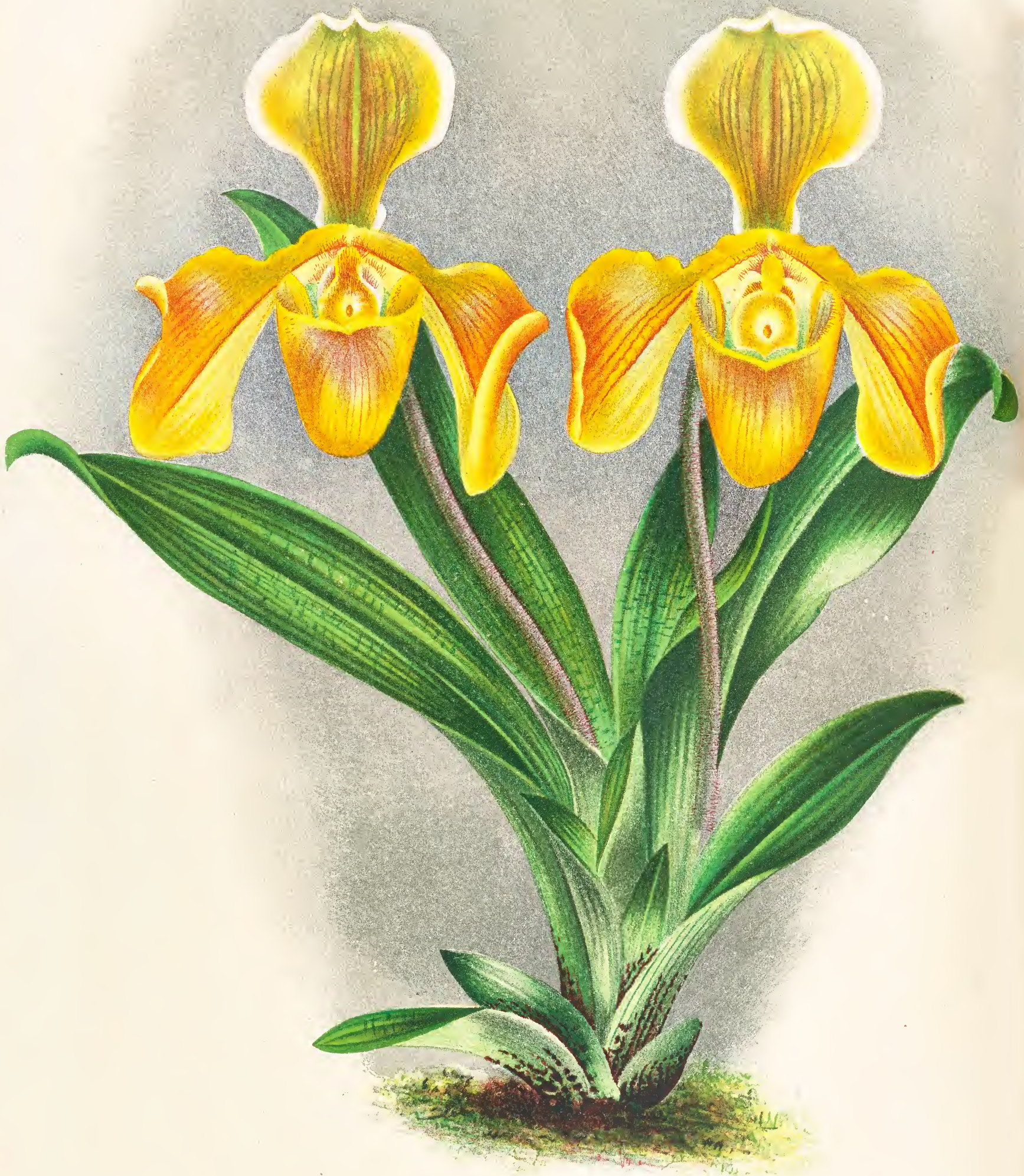
CYPRIPEDIUM X AURIFERUM L. LIND.