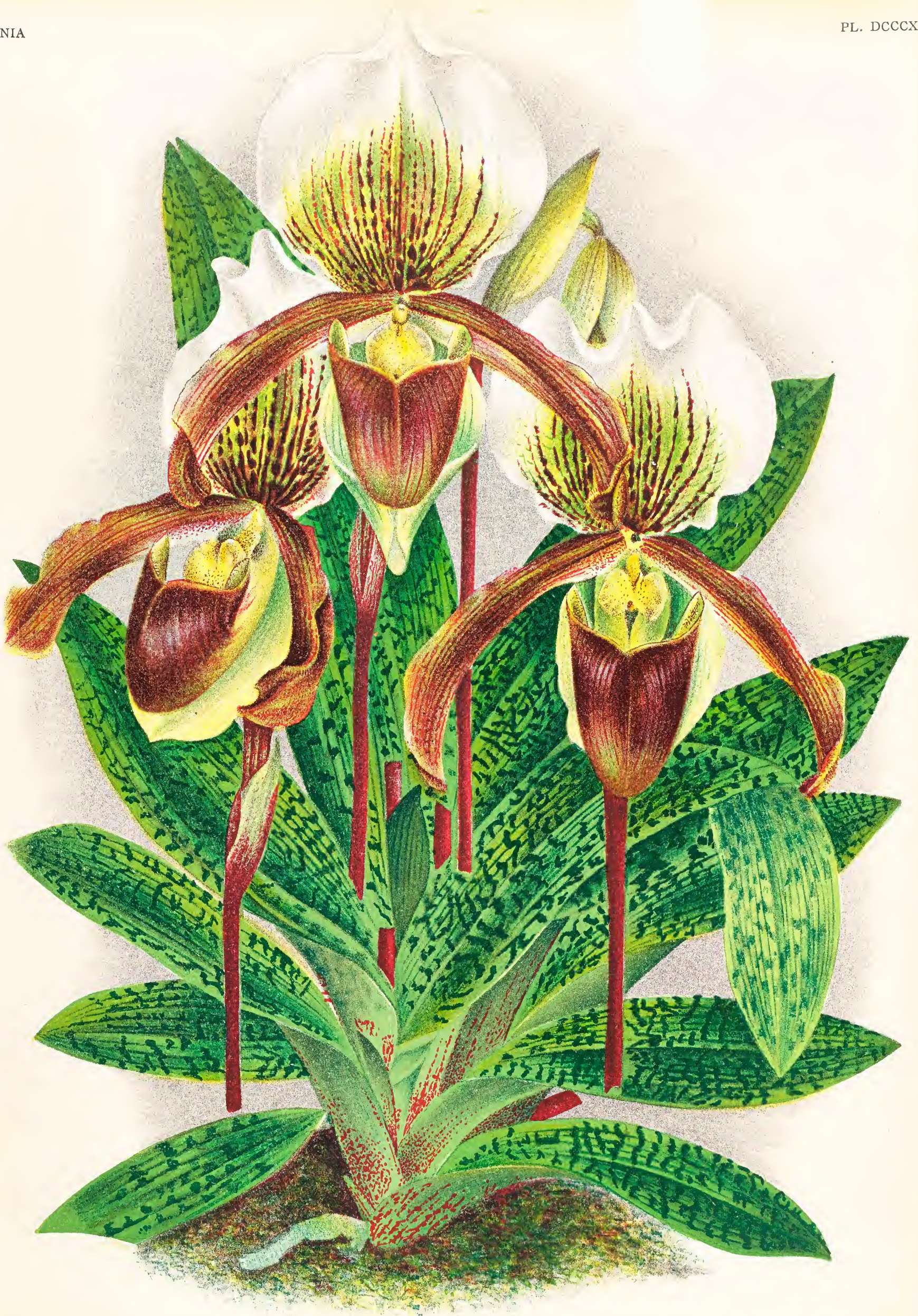
CYPRIPEDIUM × CHANTINO-LAWRENCEANUM HORT.