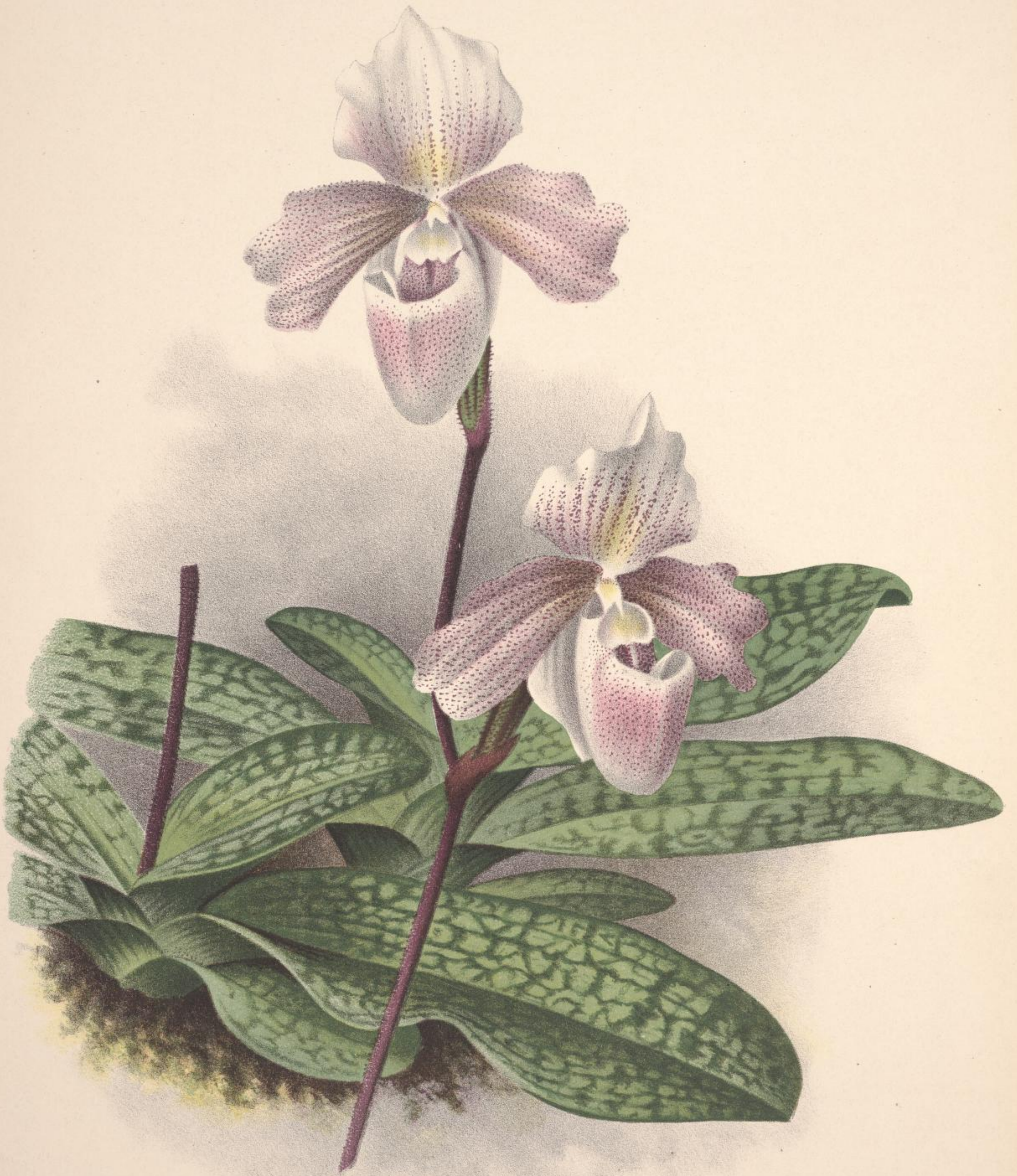
CYPRIPEDIUM × MADAME OCTAVE OPOIX HORT.