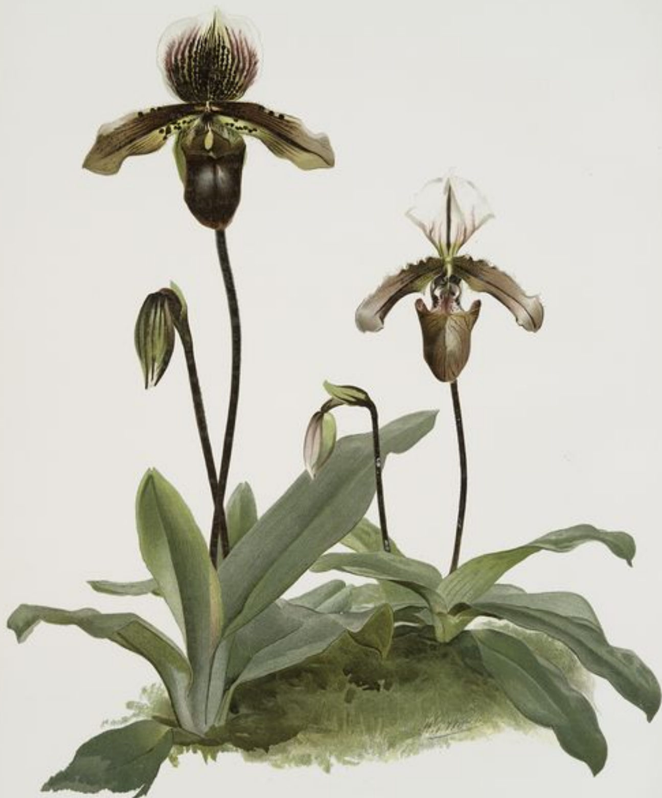
1. CYPRIPEDIUM (HYBRIDUM) POLLETTIANUM . 2. CYPRIPEDIUM (HYBRIDUM) MAYNARDII .